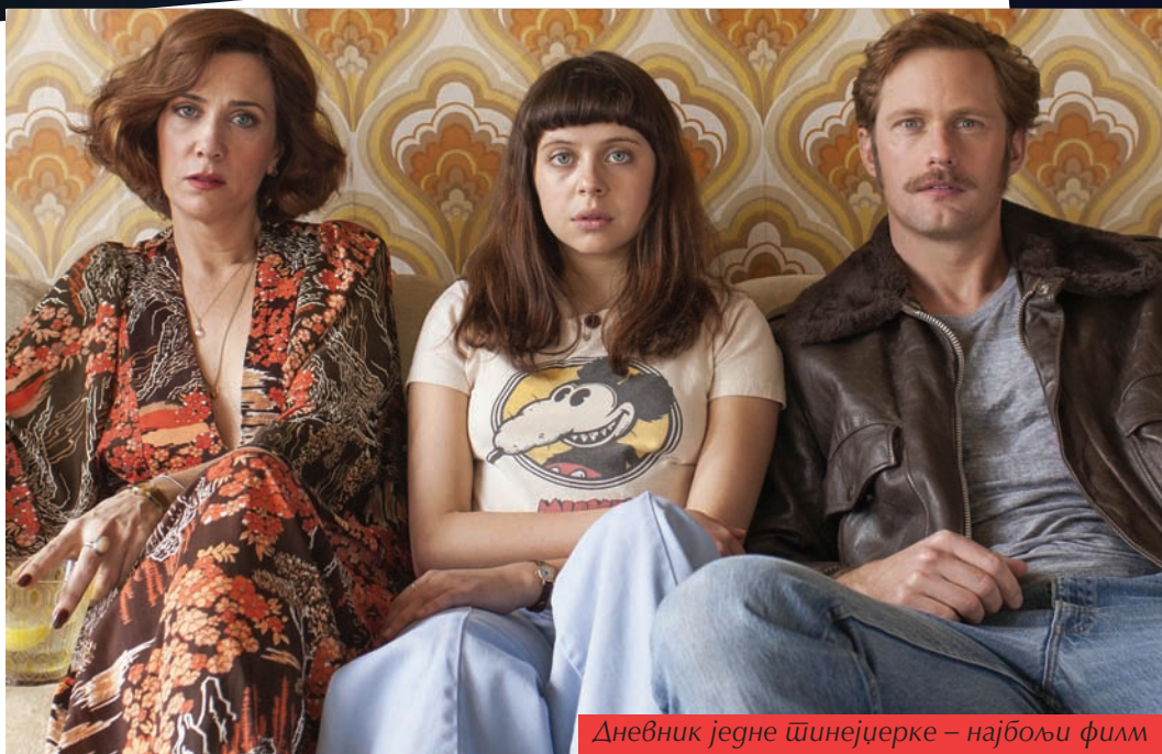
Дневник једне тинејџерке – најбољи филм у Главном такмичарском програму

„Влажност“ је филм који је и отворио овогодишњи Фест. То је дебитантски играни филм Николе Љуце.